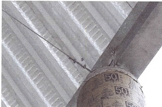
EST-CAN-001 SUMINISTRO, FABRICACION Y COLOCACION DE CANALON DE DESAGUE A BASE DE LAMINA GALVANIZADA CAL. 11, INCLUYE: SOLDADURA.